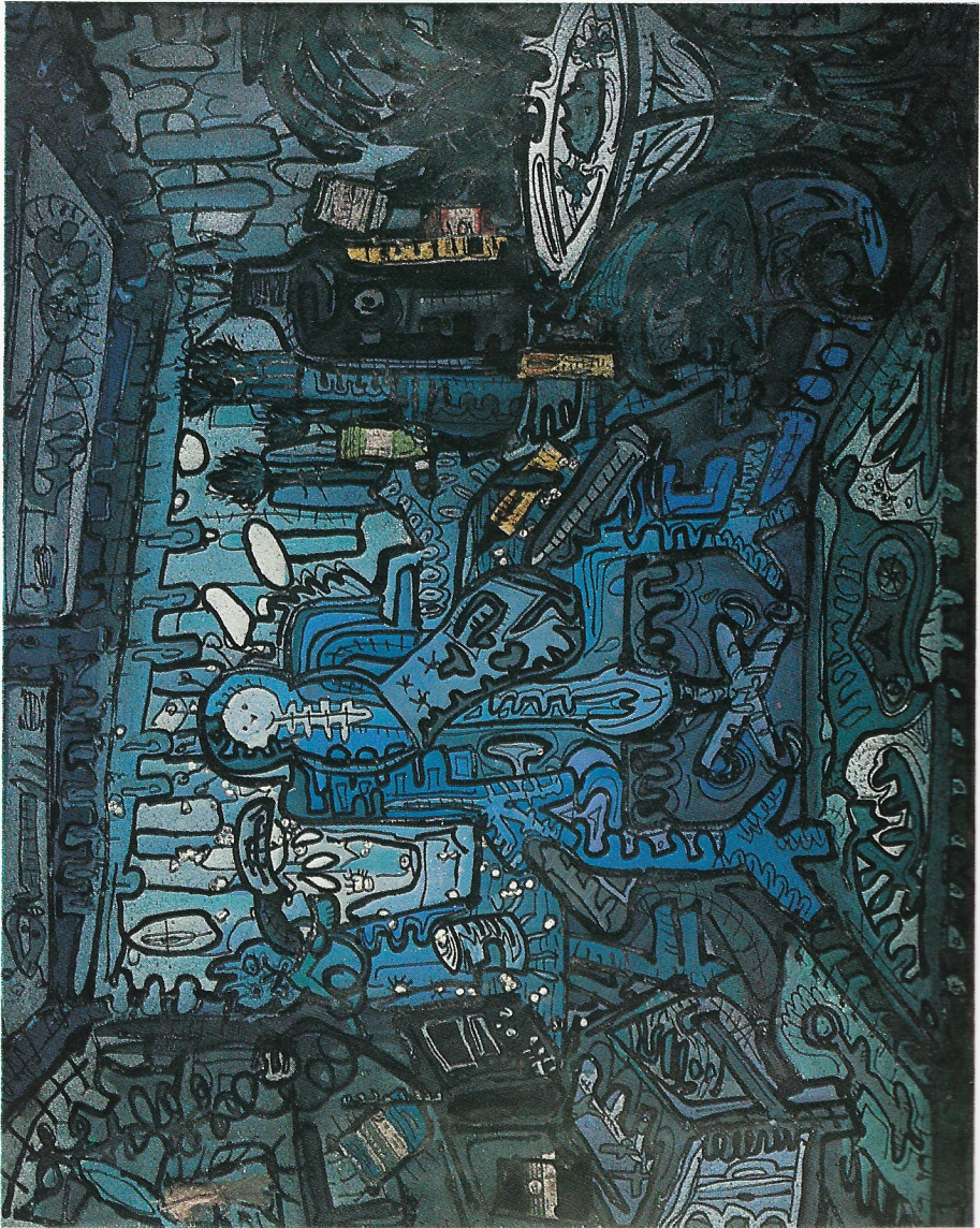
'ESTUDI I' 104 x 74 cm.