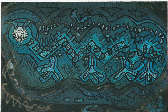
"CUC" 70×50 cm.