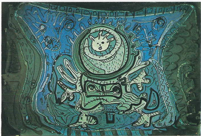
"ELEMENT 2" 65×50 cm.