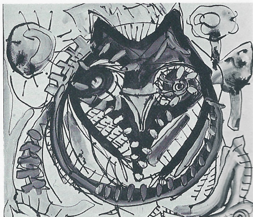
"MUSSOL" 55×50 cm.