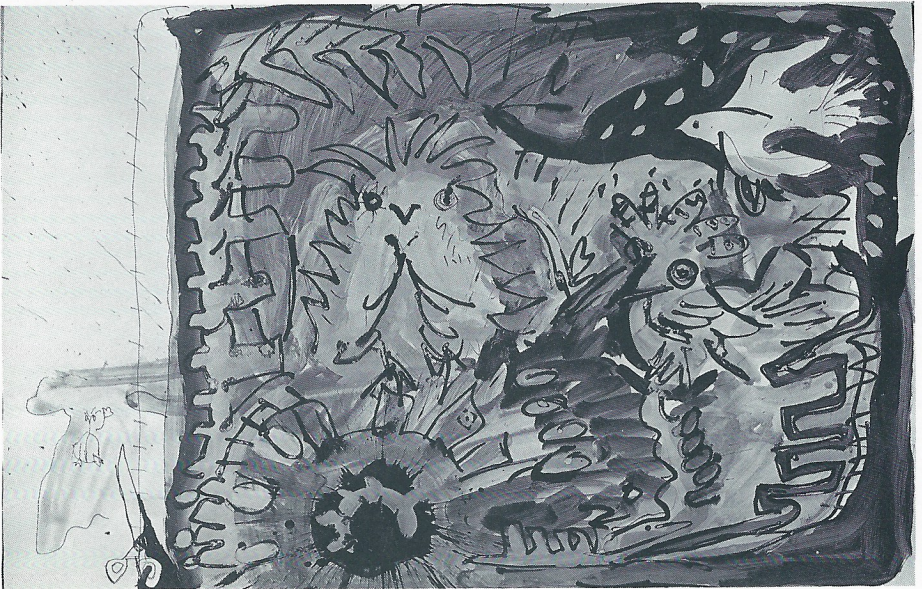
"ESTISORES" 100x65 cm.