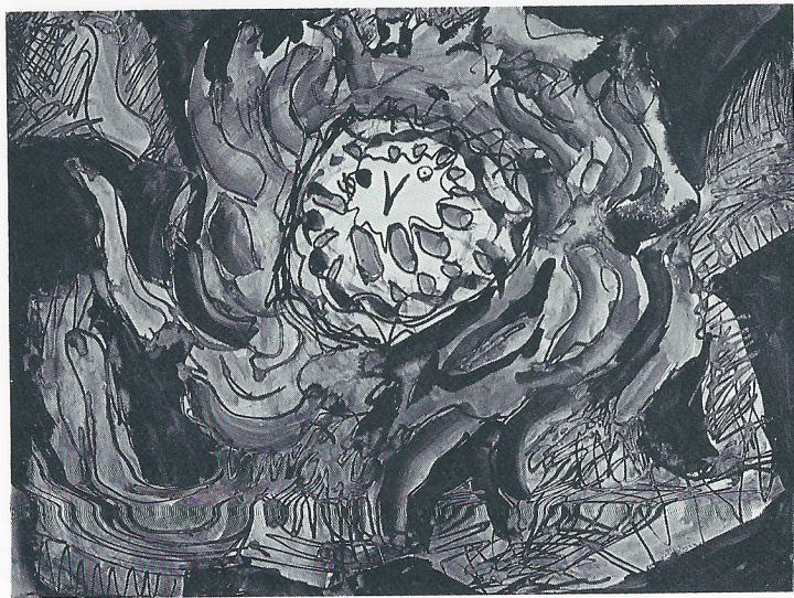
"NIU" 65×50 cm.