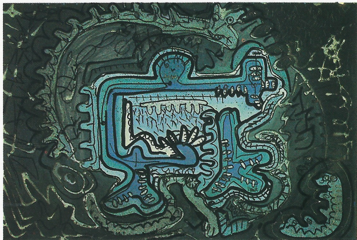
"ELEMENT 1" 70×50 cm.