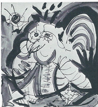
"ORNIT" 52×47,5 cm.